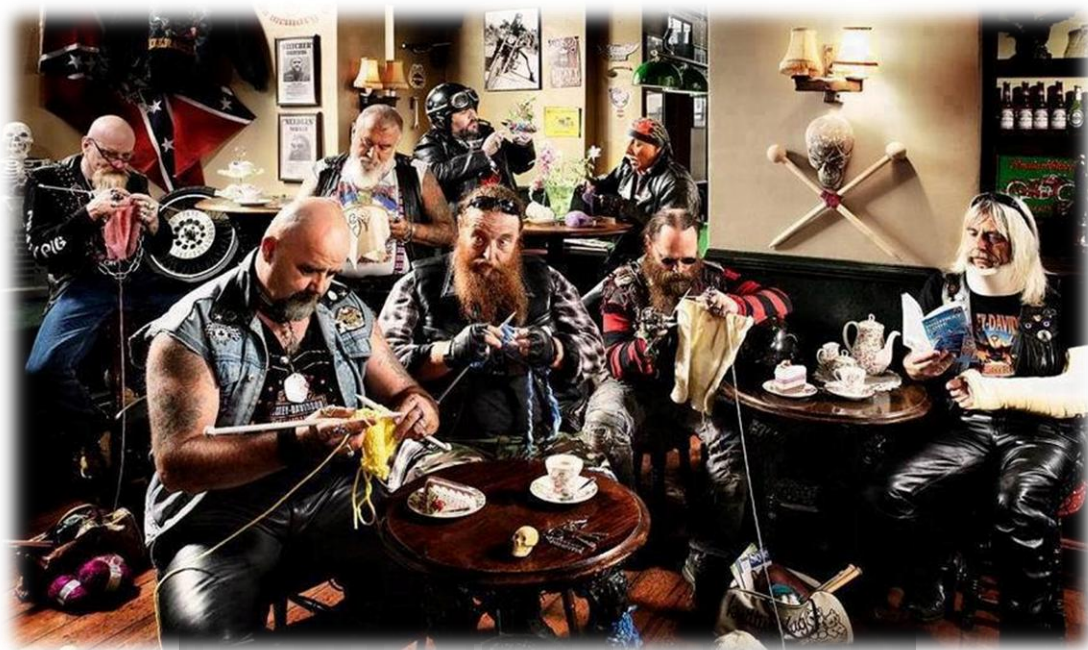
Det har vært en lang & hard vinter, men nå kan endelig medlemmene i HR Telemark legge fra seg strikkesøyet.