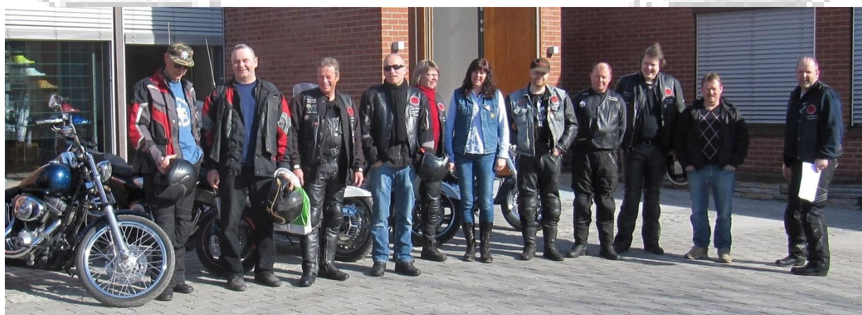
Noen av medlemmene i Holy Riders Mc Telemark utenfor Gulset kjerke.

La oss derfor gjøre det Jesus bad sine disipler om i Matt. 28, 18-20. Meg er gitt all makt på himmel og jord. Gå derfor ut og gjør alle folkeslag til disipler, idet dere døper dem til Faderens og sønnens og den hellige ånds navn, og lærer dem å holde alt jeg har befalt dere. Og se jeg er med dere alle dager inntil verdens ende.