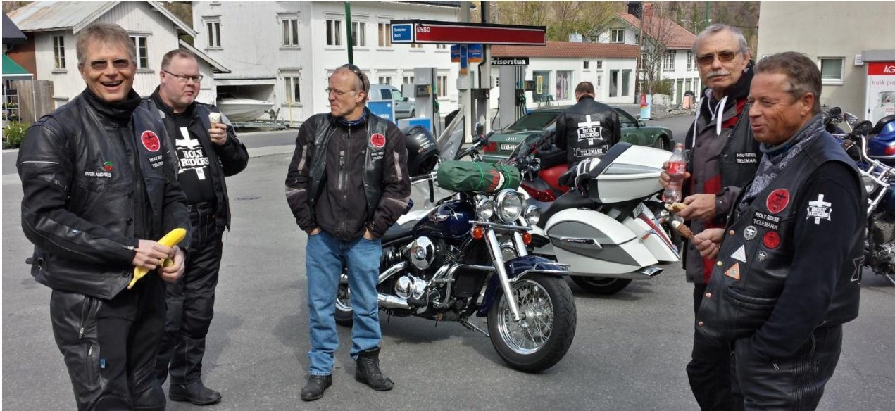
Pit-stop som vanlig i Åmot. Her er vi på veg til Evje treffet.