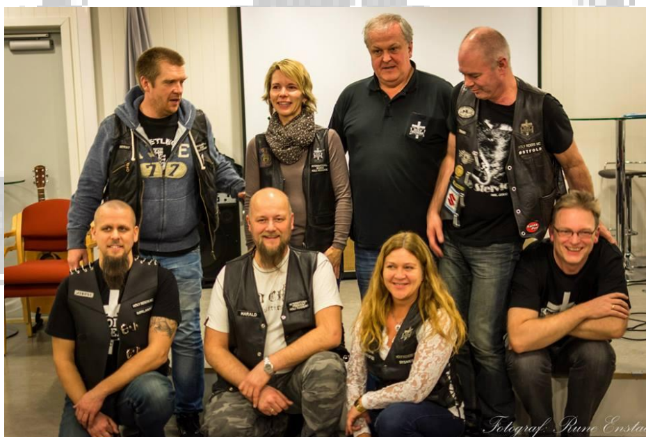
Sentralstyret i Holy Riders

Be for: Presidentparet, Sentralstyret og de øvrige lederne våre. De av oss som sliter med sykdom og plager, enten selv, eller i familien, samt for Mc vennene våre som ennå ikke kjenner Jesus.