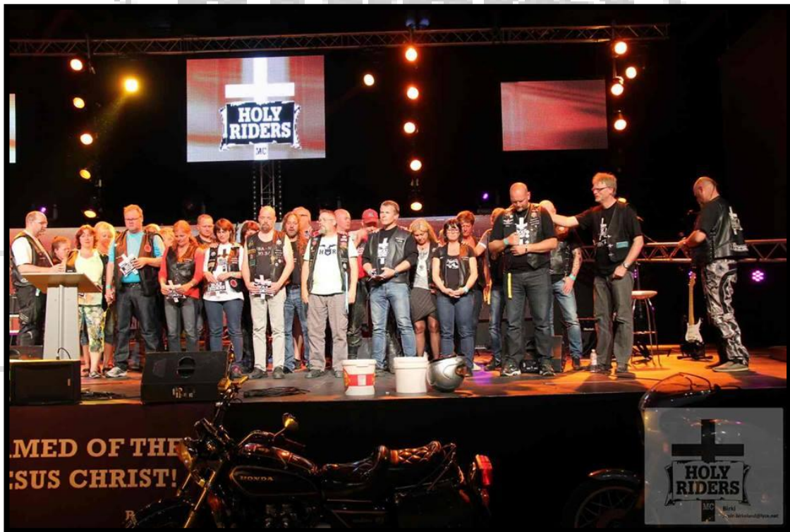
Forbønn for nye Holy Riders MC misjonærer på Pilegrimstreffet.