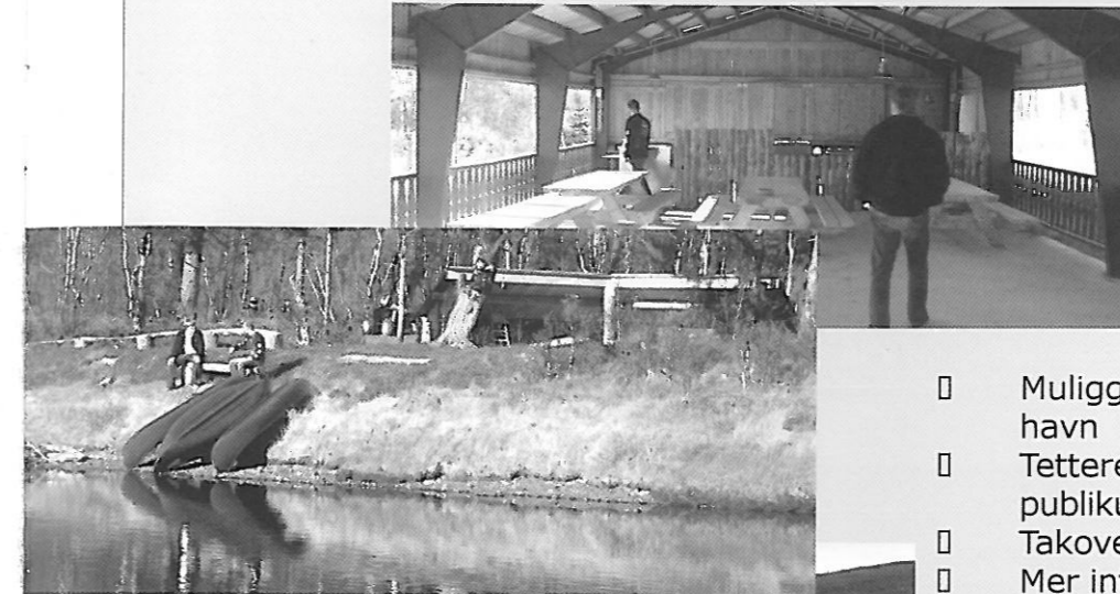
Dagali ca. 830 m.o.h.

Hvorfor bør Pilegrimstreffet fortsette på Ål? Eller hvorfor bør Pilegrimstreffet flyttes til Dagali? Du bestemmer gjennom avstemming på årsmøtet, men her er noen momenter å ta stilling til. Nedenfor er det gitt noen momenter å tenke igjennom. Forhold som er tilnærmet like på begge alternativene er ikke omtalt. Noen momenter kan ses på både som positive og negative - hva synes du?