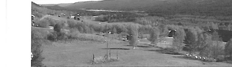
Ål i Hallingdal ca. 450 m.o.h.