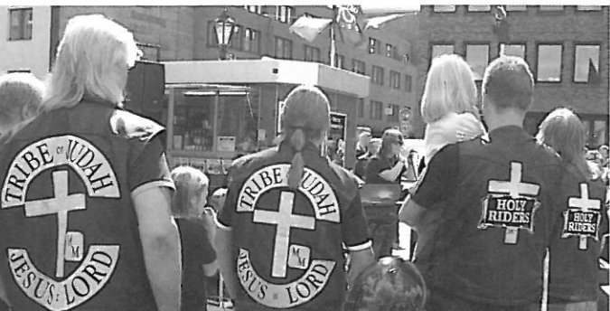
I början på augusti ordnade vi tillsammans med Tribe of Juda, den kristna europeiska träffen EMC.

Äret som varit har varit ett mycket välsignat år på många vis. Vi har fått en del nya medlemmar som hängivet vill vara med och tjäna Herren med sina mc. Några större träffar vi varit på under året