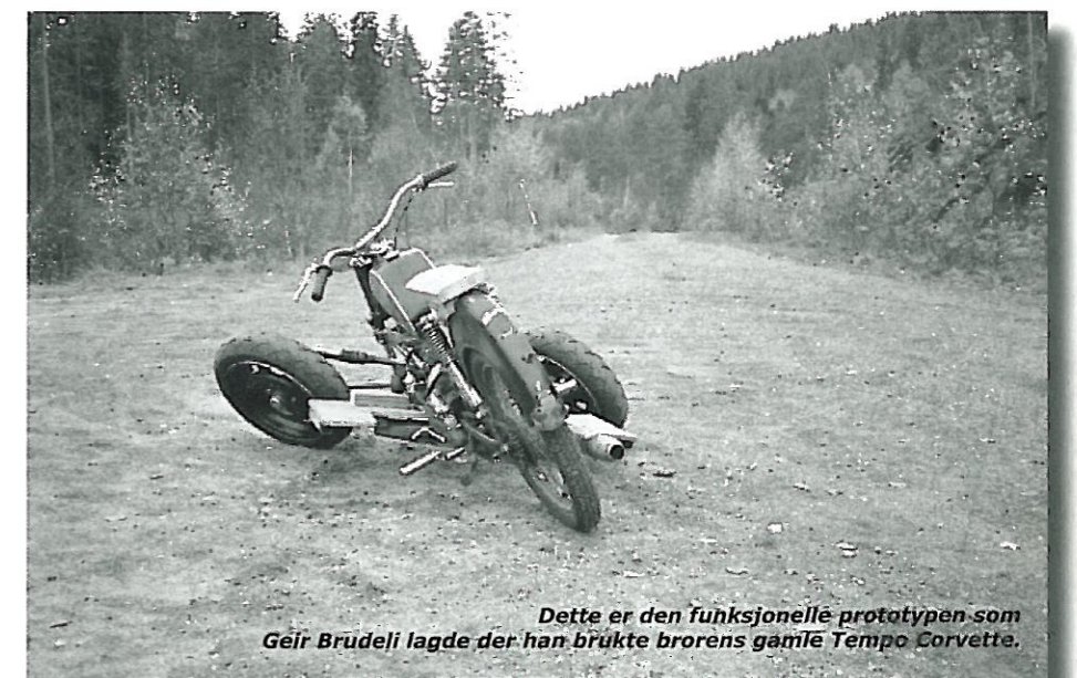
Dette er den funksjonelle prototypen som Geir Brudeli lagde der han brukte brorens gamle Tempo Corvette.