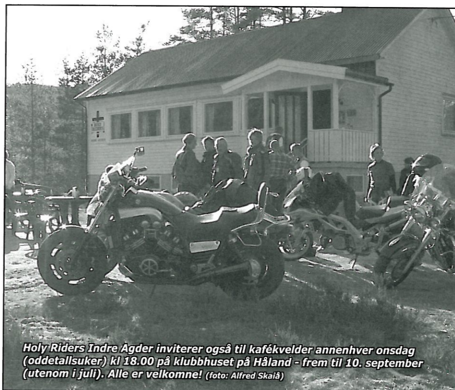
Holy Riders Indre Agder inviterer også til kafékvelder annenhver onsdag (oddetallsuker) kl 18.00 på klubbhuset på Håland - frem til 10. september (utenom i juli). Alle er velkomne!

Nå ser vi fram til Fulltreffet som Sandnes MC arrangerer i juni. Der er vi velkomne med kaffeteltet. Vi takker Sandnes MC for glimrende samarbeid og ser fram til fortsettelsen.