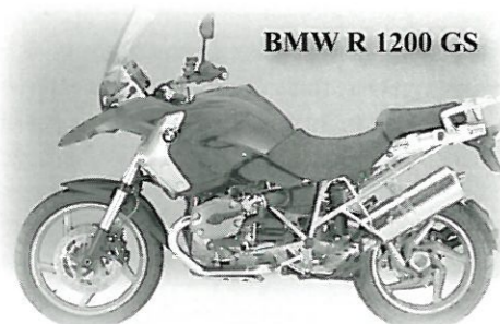
BMW R 1200 GS

Når du må offroad for å få budskapet frem!