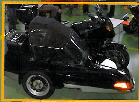
Jone Kalheim sin BMW med sidevogn og tilhenger... (se tilhengeren med en 50cc KTM i bildet under).