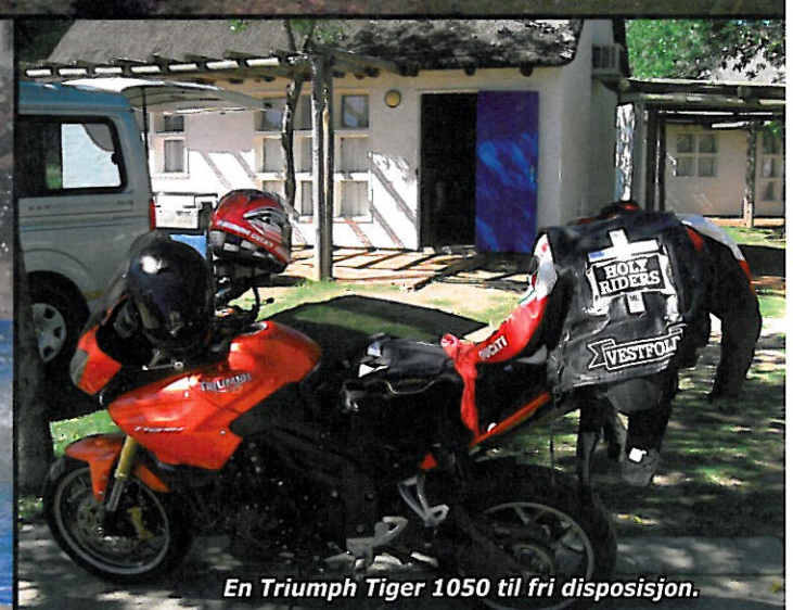
En Triumph Tiger 1050 til fri disposisjon.