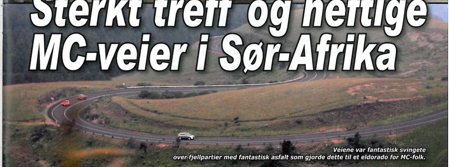
Veien var fantastisk svingete over fjellpartier med fantastisk asfalt som gjorde dette til et eldorado for MC-folk.