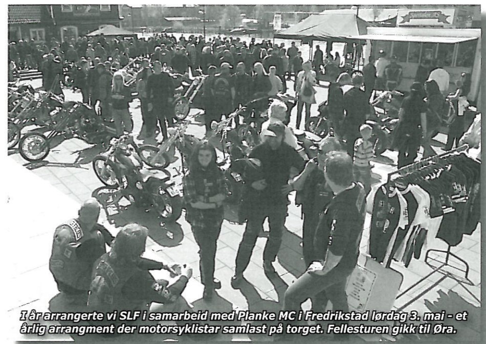
I år arrangerte vi SLF i samarbeid med Planke MC i Fredrikstad lørdag 3. mai - et årlig arrangement der motorsyklistar samlast på torget. Fellesturen gikk til Øra.