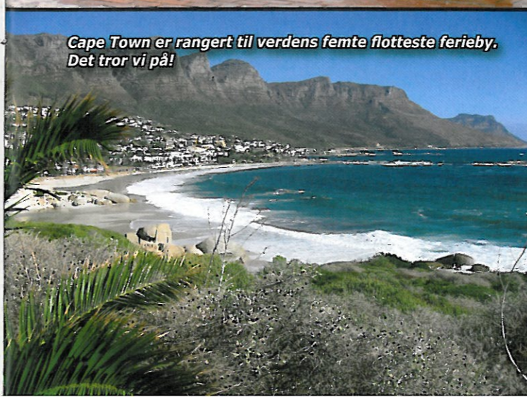
Cape Town er rangert til verdens femte flotteste ferieby. Det tror vi på!