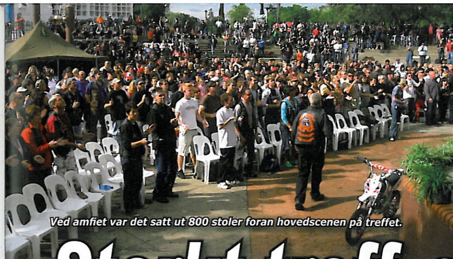
Ved amfiet var det satt ut 800 stoler foran hovedscenen på treffet.