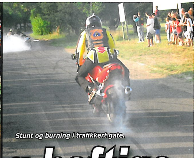
Stunt og burning i trafikkert gate.