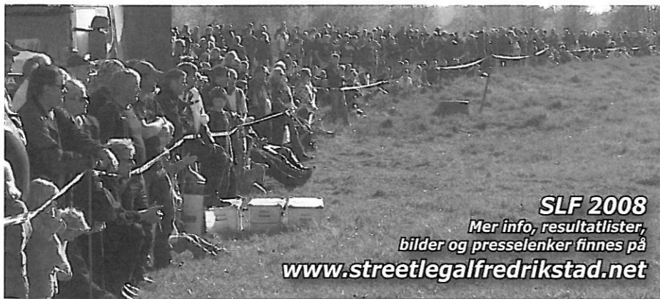
SLF 2008 Mer info, resultatlistor, bilder og presselenker finnes på www.streetlegalfredrikstad.net

Du trur det ikke før du har opplevd det. Velkommen neste år!!!