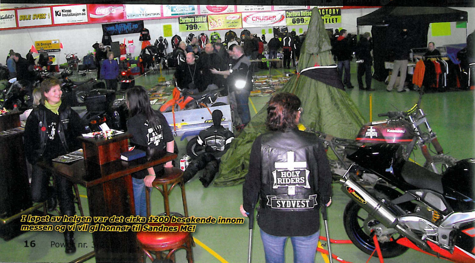
I løpet av helgen var det cirka 1200 besøkende innom messen og vi vil gi honnør til Sandnes MC!

Andre helgen i mars var det tid for MC-messe i Orrehallen arrangert av Sandnes MC. Dette har vært et årlig arrangement i en årrekke med unntak av i fjor. Holy Riders har hatt stand der en gang før. I år ble det gjort et godt forarbeid for å få best mulig resultat. Vi ville vise hva klubben står for og invitere folk med til MC-kaféen på klubbhuset vårt på Orstad som er hver torsdag i sesongen.