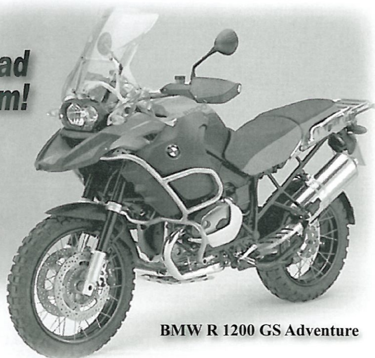
BMW R 1200 GS Adventure