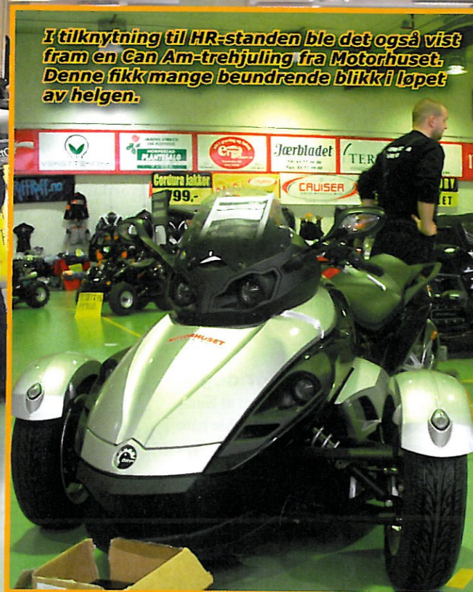
I tilknytning til HR-standen ble det også vist fram en Can Am-trehjulring fra Motorhuset. Denne fikk mange beundrende blikki løpet av helgen.