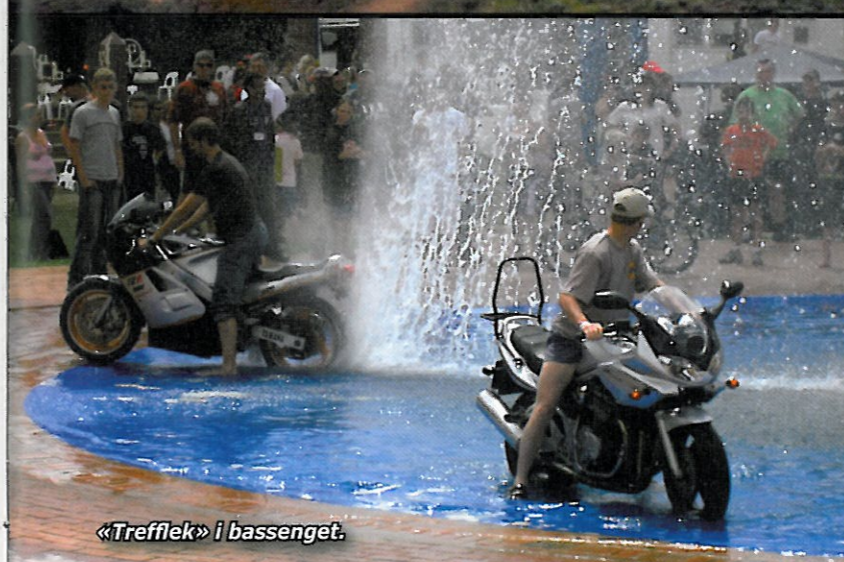
«Trefflek» i bassenget.